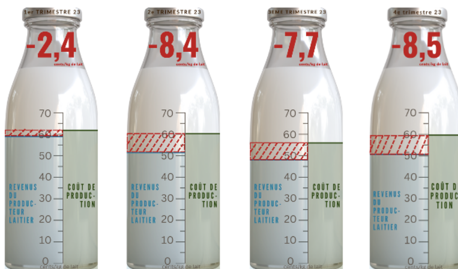
Figure 1 : La rentabilité financière de la production laitière est définie sur base de la différence entre tous les revenus et tous les coûts attribués à une exploitation laitière pour une période donnée. Les bouteilles ci-dessus représentent la part non-couverte des coûts des 4 trimestres de 2023.

Une baisse des revenus du producteur a eu lieu à partir du 2 ème trimestre en raison principalement de la diminution du prix du lait, bien que les coûts de production soient restés dans la moyenne durant les 4 trimestres (environ 59 €cents/kg rémunération cible du producteur incluse).